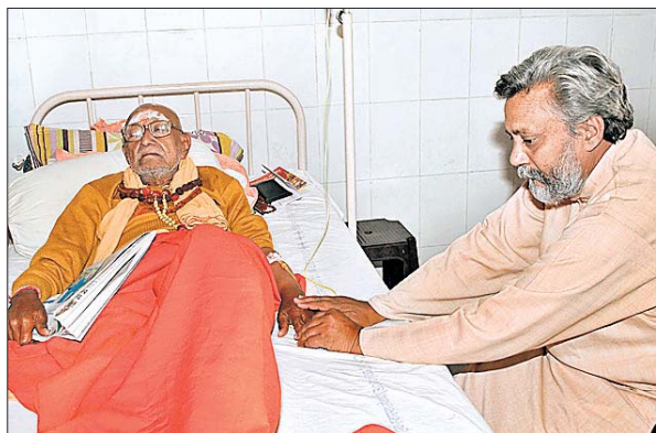
कबीरचौरा अस्पताल में स्वामी सानंद से मिलने पहुंचे राजेंद्र सिंह। 07 वें दिन भी स्वामी सानंद की गंगा तपस्या जारी

वाराणसी। गंगा तपस्या कर रहे स्वामी ज्ञानस्वरूप सानंद के समर्थन में हिंदू और मुसलमान खुल कर सामने आ रहे हैं। सातवें दिन गुरुवार को मुलाकात करने वाले मुसलिम धार्मिक नेताओं ने जहां गंगा के सवाल पर 17 मार्च को मुर्ती बंद करने का प्रस्ताव रखा वहीं इसी तारीख को कई संगठनों ने बनारस बंद की चेतावनी देकर समस्त व्यापारिक संगठनों से संपर्क जारी रखा है। दूसरी ओर स्वामी सानंद की ओर से जारी संदेश में कहा गया है कि उनकी दिली इच्छा है कि न तो बनारस बंद हो और न ही मुर्ती बंद।