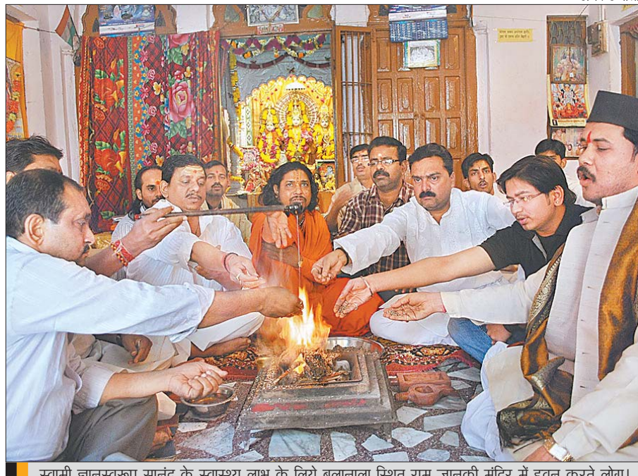
स्वामी ज्ञानस्वरूप सानंद के स्वास्थ्य लाभ के लिये बुलानाला स्थित राम जानकी मंदिर में हवन करते लोग।